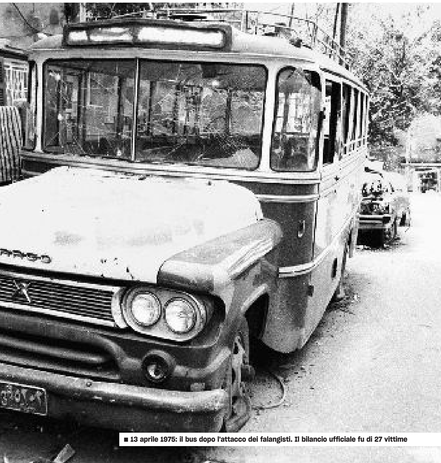
■ 13 aprile 1975: il bus dopo l'attacco dei falangisti. Il bilancio ufficiale fu di 27 vittime