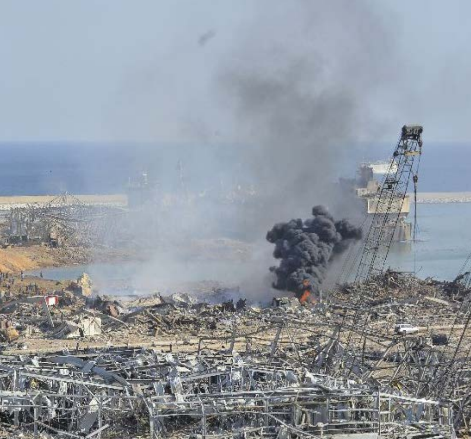
■ 4 agosto 2020: una gigantesca esplosione devasta il porto e la città