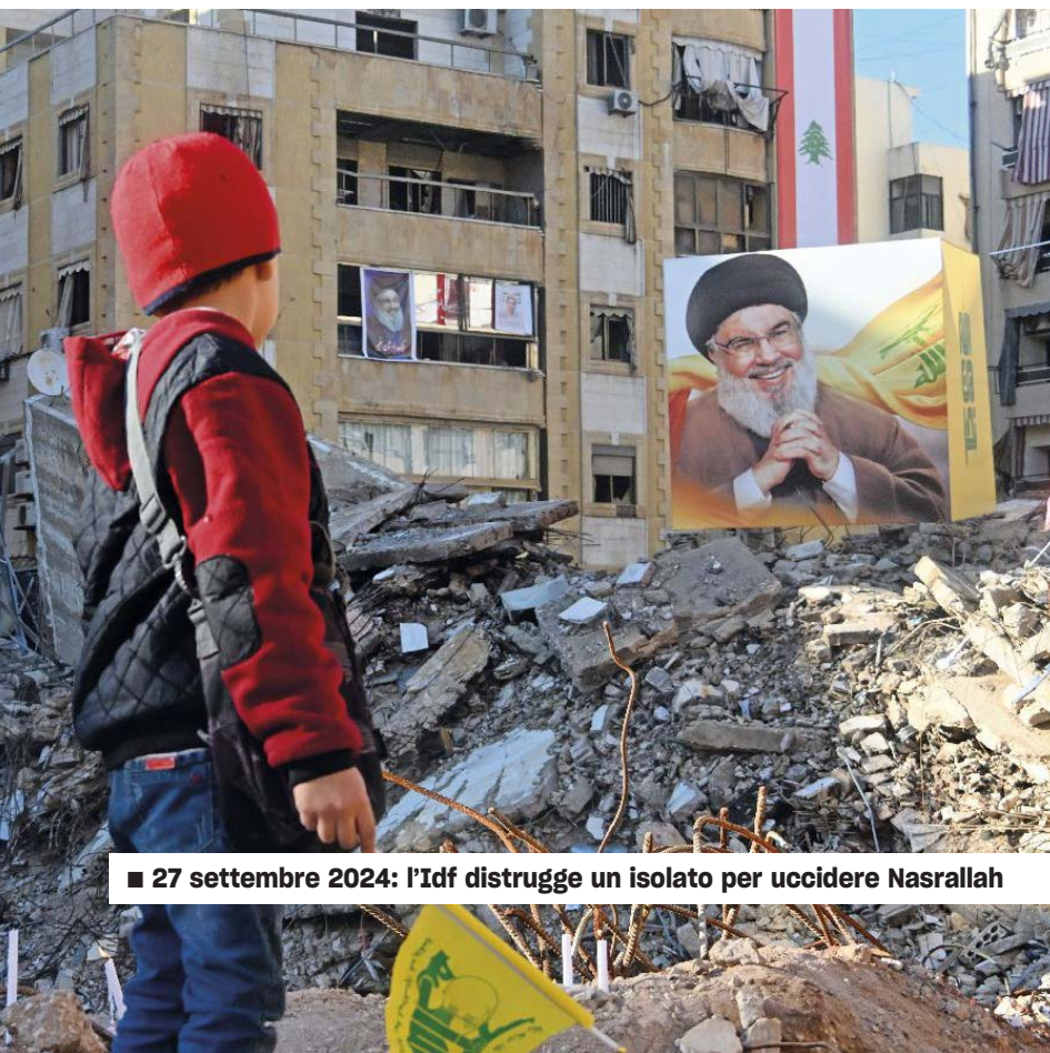
■ 27 settembre 2024: l'Idf distrugge un isolato per uccidere Nasrallah